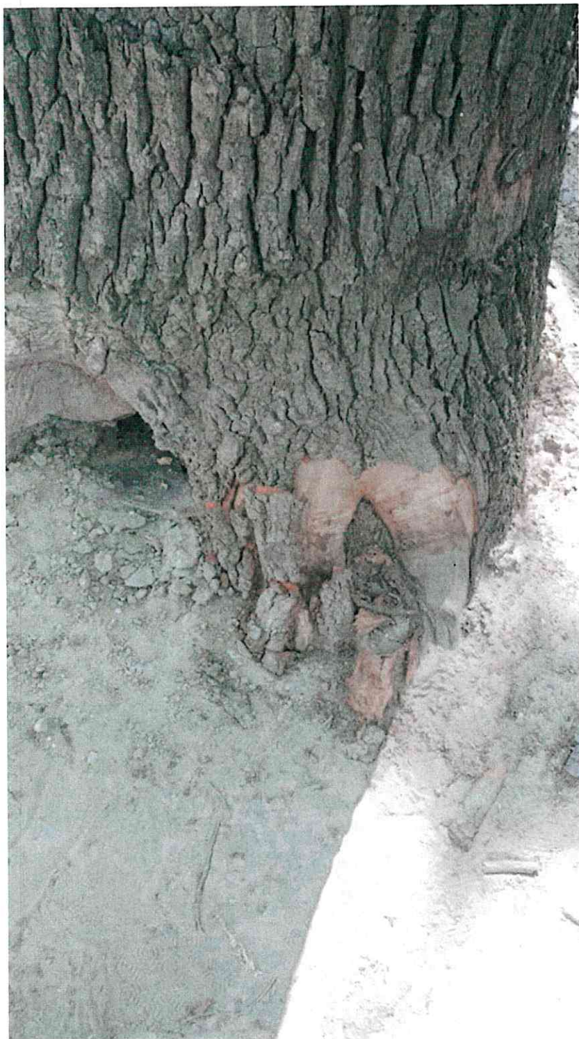
Uszkodzone drzewo numer 2