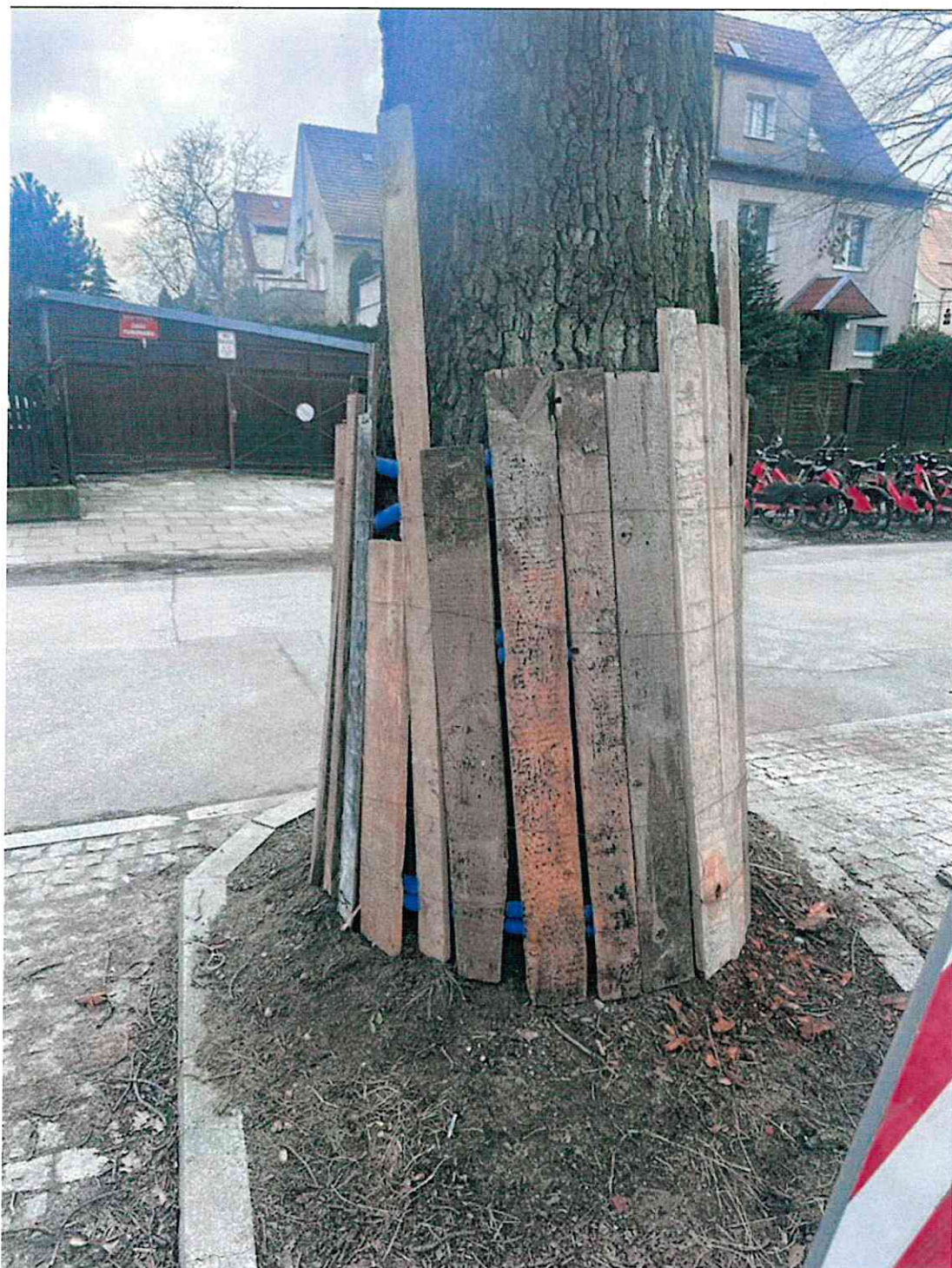
Uszkodzone drzewo numer 1