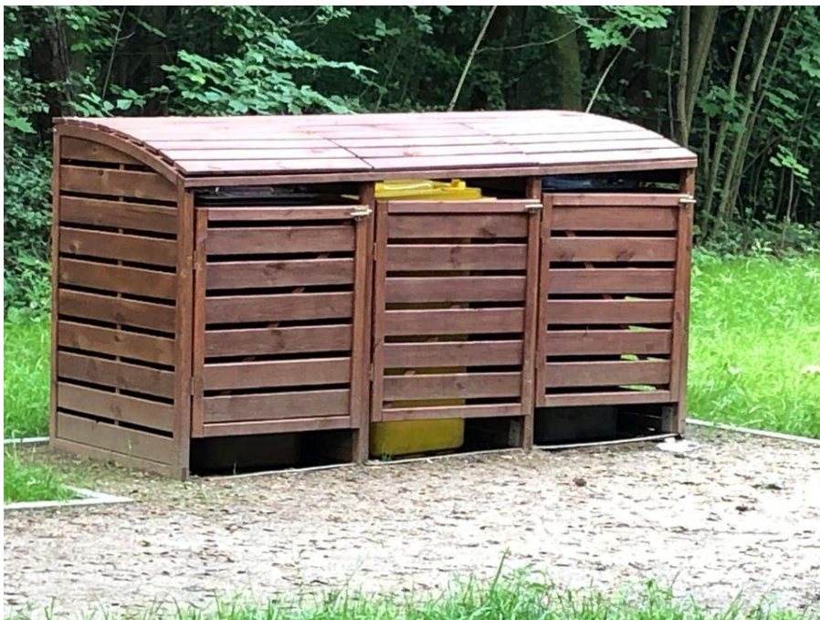
Zdjęcie 6. Nieoznakowane śmietniki bez możliwości otwarcia od góry, zawiasy już wyłamane