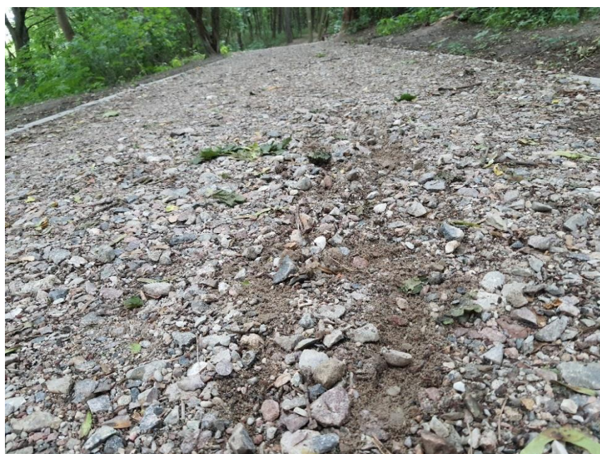
Zdjęcie 4. Nieutwardzony tłuczeń i otoczaki bez odpowiedniej gliniastej warstwy wierzchniej uniemożliwiają podjazd pod górki