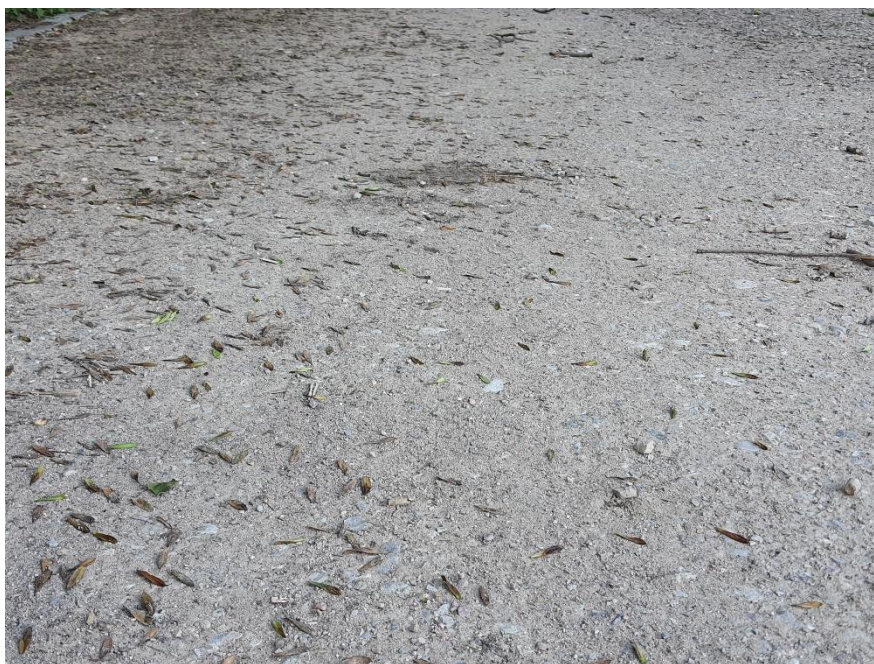
Zdjęcie 1. Fragment ścieżki utwardzony mechanicznie o dobrych właściwościach użytkowania

jakość wykonania jest lepsza, natomiast część ścieżek była wyrównana ręcznie i tam korzystanie jest co najmniej utrudnione.