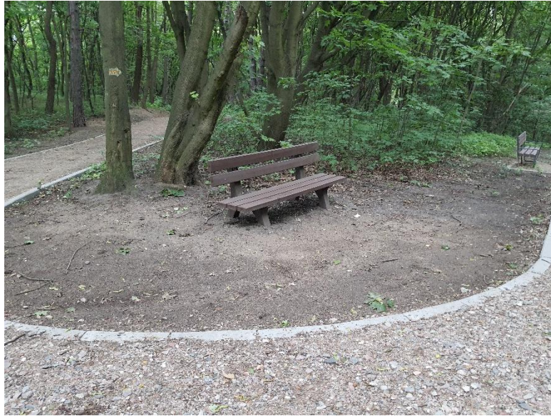
Zdjęcie 5. Porzucona ławka