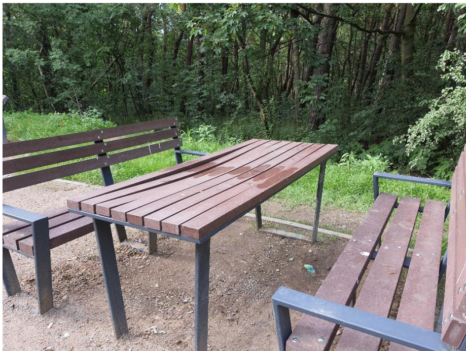
Zdjęcie 7. Jeden ze stołów na polanie rekreacyjnej

Prosimy o poważne potraktowanie zgłoszonych problemów.